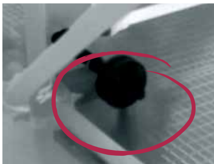
Das Gasleck lässt sich auf dem Wärmebild deutlich erkennen.

Kohlendioxid (CO 2 ) gilt als relativ preisgünstiges Tracer gas zum Ausführen von Dichtigkeitstests. Außerdem gilt diese Methode als zuverlässig, kann zum Überprüfen komplexer Anlagen genutzt werden, und CO 2 lässt sich generell einfach beschaffen. Mit optischen Gasdetektionskameras wie der FLIR GF343 können Sie CO 2 -Lecks schnell, einfach und aus sicherer Entfernung erkennen. Dies ist insbesondere bei Stillstandszeiten und Abschaltungen hilfreich, um die Inertisierung und Füllung der Anlagenkomponenten zu überprüfen.