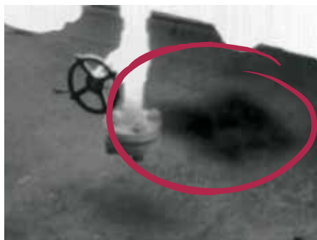
An einem Produktionsstandort erkanntes Gasleck

Mit optischen Gasdetektionskameras wie der FLIR GF320 lassen sich Lecks an Rohrleitungen, Flanschen und Verbindungen in petrochemischen Anlagen aufspüren. Dabei kann die GF320 schnell weitläufige Bereiche überprüfen und Lecks darin auffindig machen. Dadurch eignet sie sich ideal zum Überwachen von Anlagen, die mit kontaktbasierten Messinstrumenten schwer erreichbar sind. So lassen sich in einer Schicht buchstäblich Tausende Komponenten überprüfen, ohne dass die laufenden Prozesse dafür unterbrochen werden müssen. Dadurch sind weniger Stillstandszeiten für Reparaturen erforderlich, und der gesamte Prozess lässt sich lückenlos überprüfen und nachvollziehen. Darüber hinaus ist er außerordentlich sicher, da sich potenziell gefährliche Lecks (z. B. durch Methan) aus mehreren Metern Entfernung überwachen lassen.