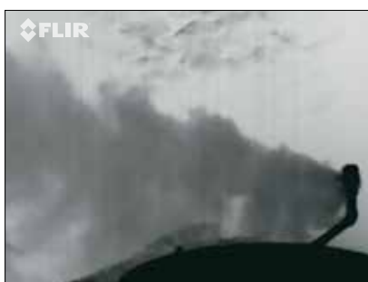
Entlüftungsüberdruckventil an einem Lagertank