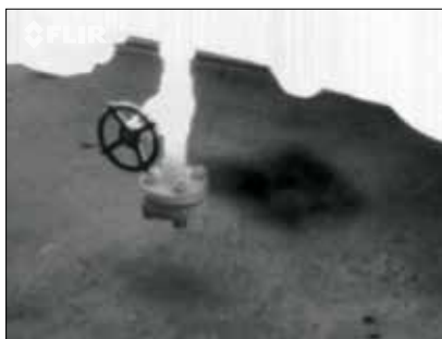
Methanleck an einer Gasförderstelle